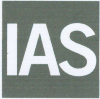
King Cert International Certification Ltd. Director

ACCREDITED Management Systems Certification Body MSCB-196